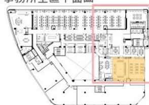
事務所全區平面圖