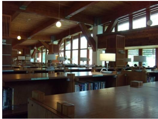
符合人體工學書架設計。