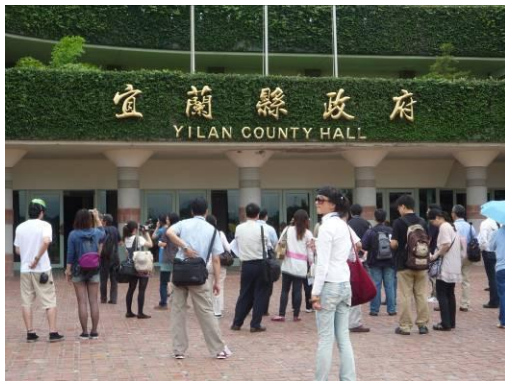
集合簽到、老師解說綠建築指標。