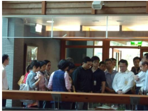
學員觀賞北投圖書館立體配置模型。