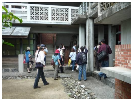
解說開放空間留設。