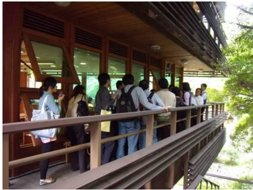
自然通風節能設計解說。