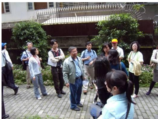
解說開放空間留設。