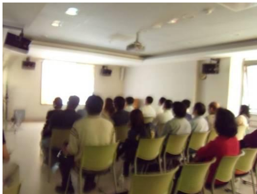
學員觀賞北投圖書館影片。