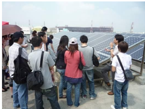
介紹太陽能光電板。