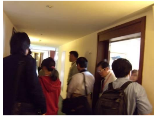
住宿區室內環境介紹。