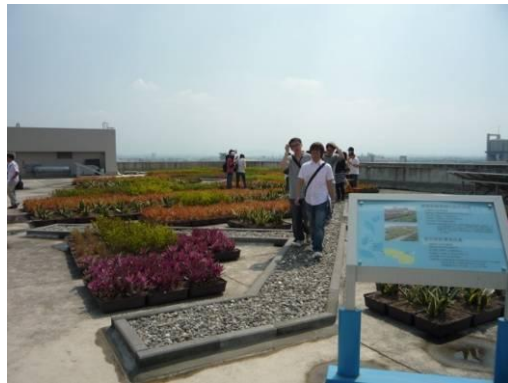
頂樓花園造景示意圖。