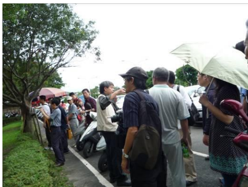
綠建築設計概念概論。