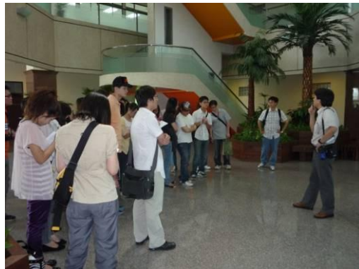
歐文生老師簡報綠建築議題。