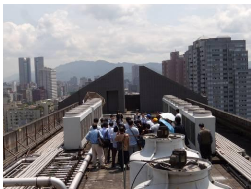
屋頂空調節能介紹。