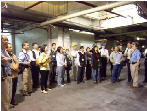
簡介污水處理系統。