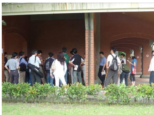
集合簽到、老師解說綠建築指標。