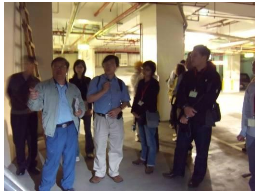
介紹垃圾處理系統。