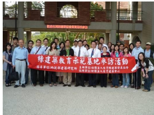
參訪活動結束，學員於門口合照。