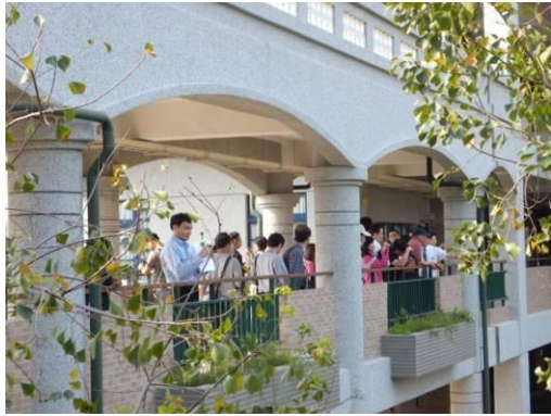
空中走廊、創造多樣性小生物棲息地。