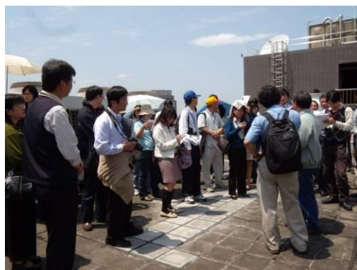
學員討論空調事宜。