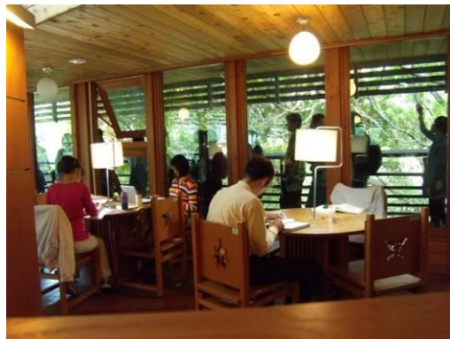
學員參觀陽台外景致