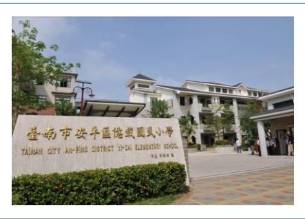
台南市安平區億載國民小學