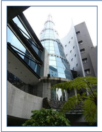
公務人力發展中心

公務人力發展中心前身為行政院人事局於民國 57 年臨時設置之「公務人員訓練班」，中心設立宗旨係為培訓行政院所屬中高級公務人員管理發展知能，辦理人事人員專業訓練暨公務人員業務講習與研討，研究開發人力資源，並就訓練技術與方法進行研究、評估及推廣。公務人力發展中心至 89 年 10 月完成各項設施並正式啟用，位於台北市新生南路、辛亥路口，大樓樓地板面積計 43,665 平方公尺，為地上 14 層及地下 3 層之建築，規劃了行政區、教學區、會議區、生活區、休閒區及公共設施等六部分，建築造型採簇群建築形式，園內採全面綠化、景觀共享之目標，建築均採南北座向，住宿動採雙層牆面設計，可節省空調能源，並設中水回收系統，具環保節能作用。另為融入整體社區概念，園內設施開放社區民眾使用並不設立圍牆，將政府機關結合社區機能規劃。當時綠建築規範尚在研究擬定階段，設計團隊手上並無綠建築規範，只基於對防止西曬、節能、節水、綠化等環境課題的瞭解，認為公共工程應率先做這方面的設計，方能節省其營運上之經常業務費用，結果園區以 93 年公布的九項綠建築指標檢查公務人力發展中心尚稱大部分達成。也因此獲得了內政部 2003 年優良綠建築設計獎。