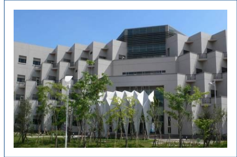
台達電子股份有限公司南科廠。

台達電子集團為台灣電力電子產業的龍頭，台達電子集團營運據點遍佈全球，並在台灣、中國、泰國、墨西哥、印度以及歐洲等地設有製造工廠。在 2008 年，台達電子除了七度蟬聯天下雜誌標竿企業評選中電子業的榜首，榮登遠見雜誌企業社會責任獎的榮譽榜，以及三度名列天下雜誌的最佳企業公民外，台達亦入選 CNBC 歐洲商業雜誌的「全球百大低碳企業」(The Top 100 Low Carbon Pioneers)並持續獲頒 Sony 及 Canon 的綠色夥伴(Green Partner)。台達電子集團的經營使命是「環保、節能、愛地球」，並且長期致力於實踐環境保護的承諾，為落實所秉持的環保理念，台達電從 2004 年起，集團內所有新建廠房均須以綠建築指標作為設計精神，當年度起造、最先適用這項精神的南科廠辦，不僅勇奪 2006 年最佳優良綠建築設計大獎，並且通過全數內政部建築研究所所設定九項綠建築指標評估，成為全台首座「黃金級綠建築」，同時獲多項肯定與殊榮。