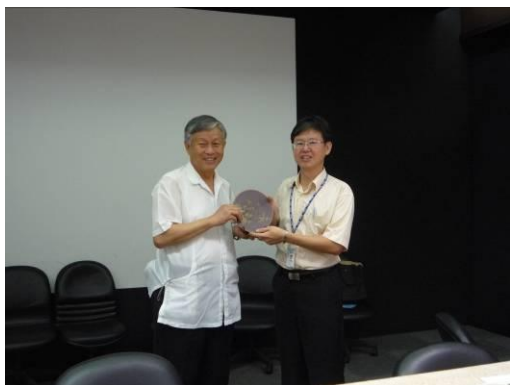
台灣省諮議會議長致贈台達電子謝禮。