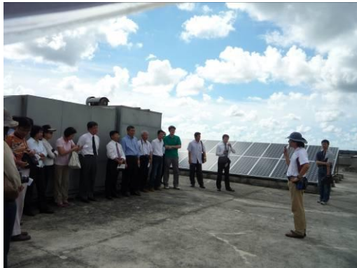
介紹太陽能光電板。