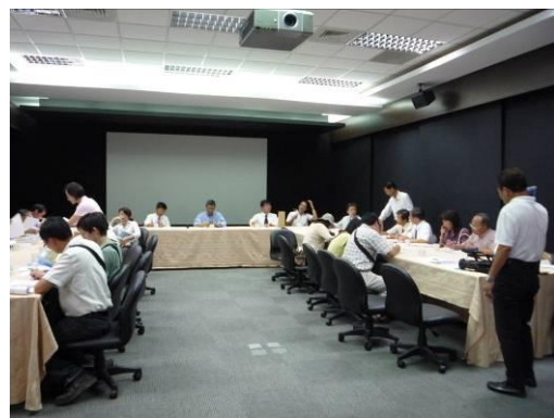
學員討論建築設計議題