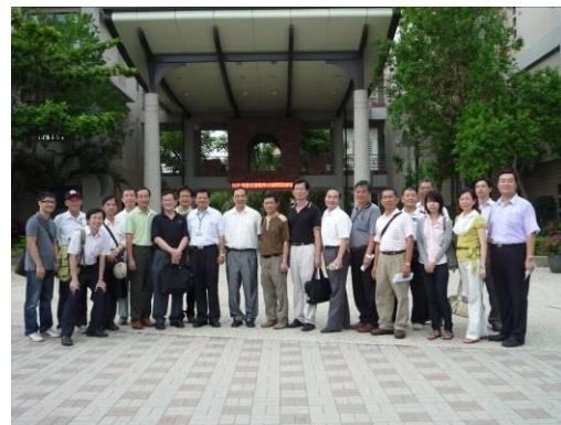
參訪活動結束，學員於門口合照。