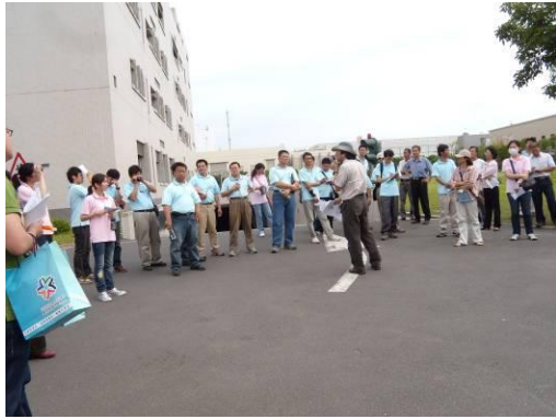
空地解說介紹環境氣候。