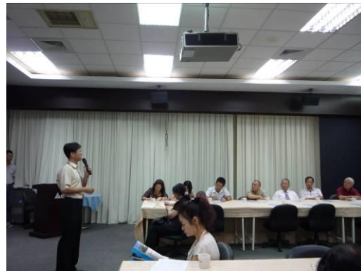
老師解說綠建築指標。