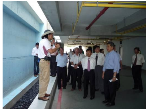
停車場通風採光說明。