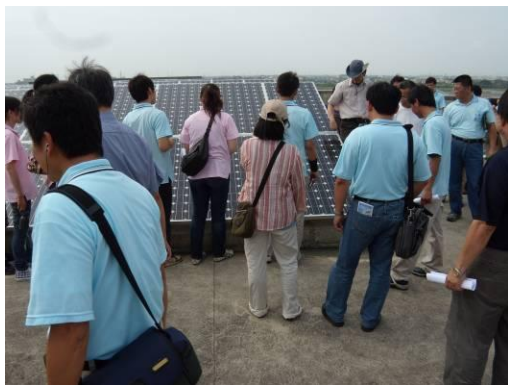
介紹太陽能發電事宜。