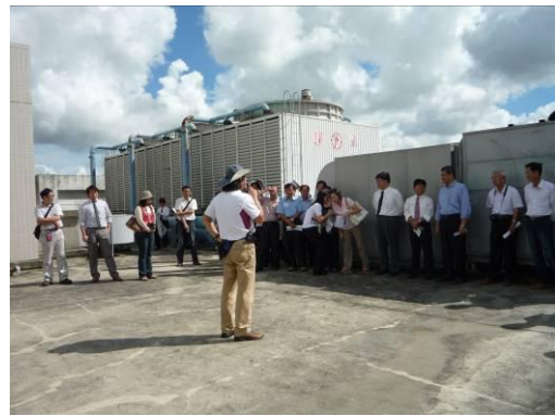
空地解說介紹環境氣候。