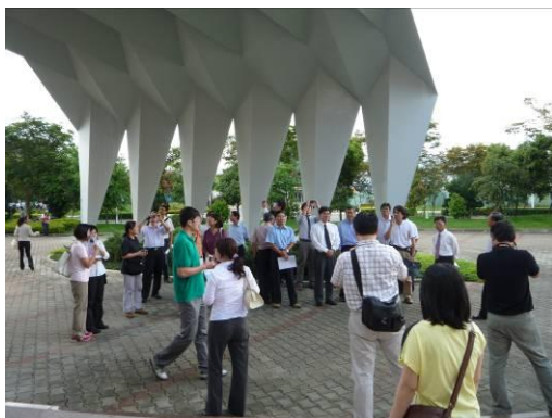
建築物座向、各地區建築特色差異說明。