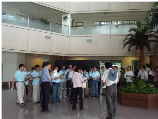
集合簽到、老師解說綠建築指標。