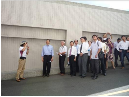
停車場建築設計介紹。