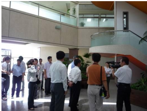
集合簽到、老師解說綠建築指標。